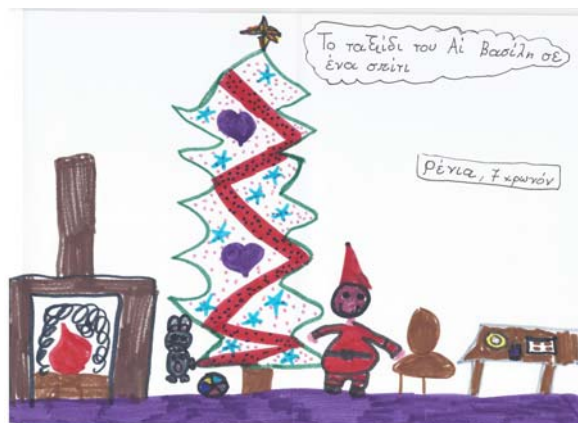
Ρένια, 7 ετών