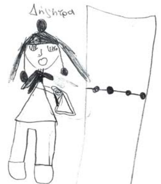
Δήμητρα, 8 ετών, Τα κάλαντα

Πρώτο έθιμο: Την Πρωτοχρονιά λέμε τα κάλαντα