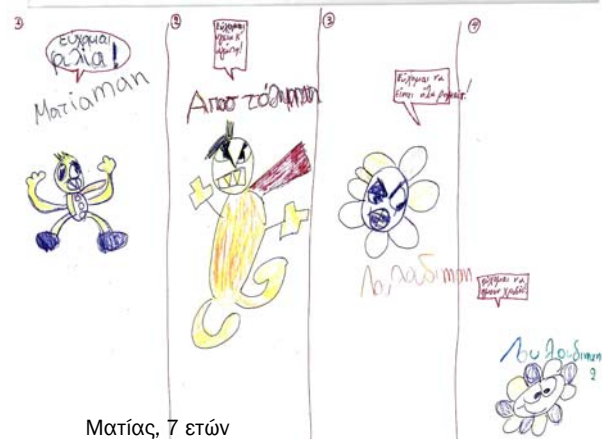
Ματίας, 7 ετών