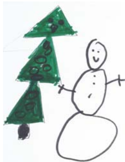
Μιχάλης, 8 ετών