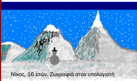
Νίκος, 16 ετών, Ζωγραφιά στον υπολογιστή

Στα χιόνια μπορείς να κάνεις πολλές δραστηριότητες όπως το έλκηθρο, το σκι, το τελεφερίκ, ο χιονοπόλεμος και το σνοουμπορντ. Μια ξεχωριστή εμπειρία στο σαλέ (ξενώνας) είναι όταν έχεις το τζάκι αναμμένο με στολισμένο δέντρο, να πίνεις ζεστή σοκολάτα και να παίζεις επιτραπέζια παιχνίδια.