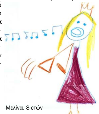
Μελίνα, 8 ετών