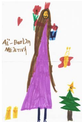
Μελιτίνη, 6 ετών

Αγαπημένε μου Άγιο Βασίλη, Θέλω να μου φέρεις για δώρο το παλάτι Μπάρμπι, Ευχαριστώ Μελιτίνη, 6 ετών