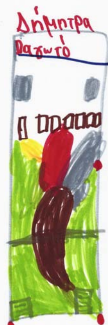
Δήμητρα, 7 ετών