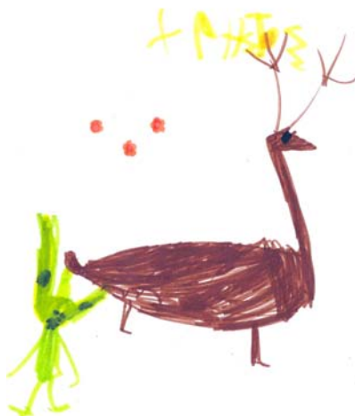
Ο τάρανδος και το Ξωτικό, Χρήστος, 7