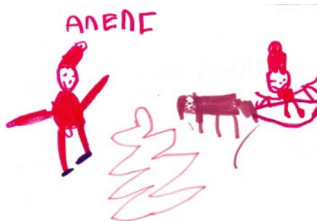
ΑΛΕΚΟΣ, 6 ΕΤΩΝ