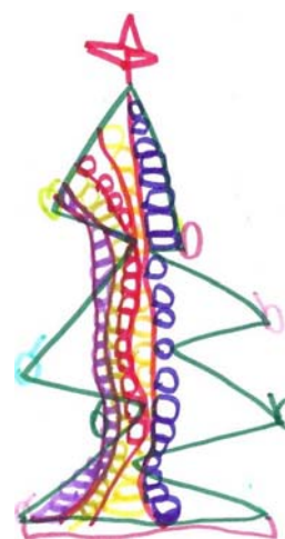
ΜΙΧΑΛΗΣ, 13,5 ΕΤΩΝ