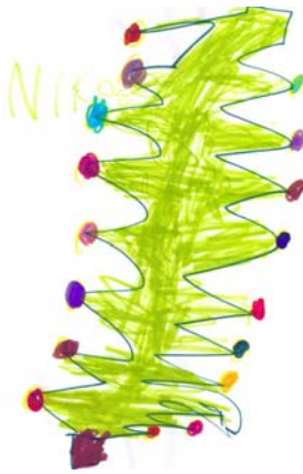
ΝΙΚΟΣ, 6 ΕΤΩΝ