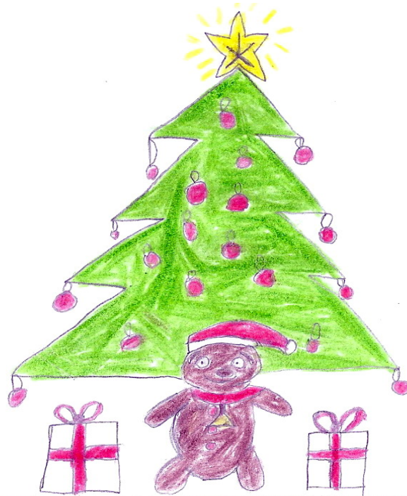
Χριστουγεννιάτικο δέντρο, Δάντης, 9 ετών

ΣΕ ΑΥΤΟ ΤΟ ΤΕΥΧΟΣ ΟΙ ΜΙΚΡΟΙ ΜΑΣ ΦΙΛΟΙ ΓΡΑΦΟΥΝ: