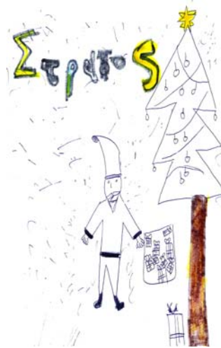
ΣΤΡΑΤΟΣ, 6 ΕΤΩΝ