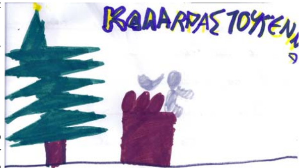
ΛΕΥΤΕΡΗΣ, 11 ΕΤΩΝ