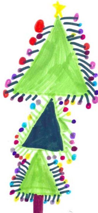
ΚΑΤΕΡΙΝΑ, 8 ΕΤΩΝ