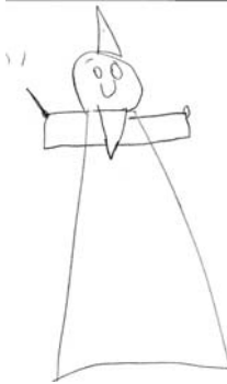
ΠΑΝΑΓΙΩΤΗΣ, 7,5 ΕΤΩΝ