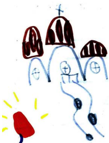
Νίκος, 6,5 ετών

Συνήθως το Πάσχα βάφουμε τα αυγά κόκκινα, πάμε στην εκκλησία. Τσουγκρίζουμε τα αυγά το Πάσχα και ανάβουμε τη λαμπάδα.