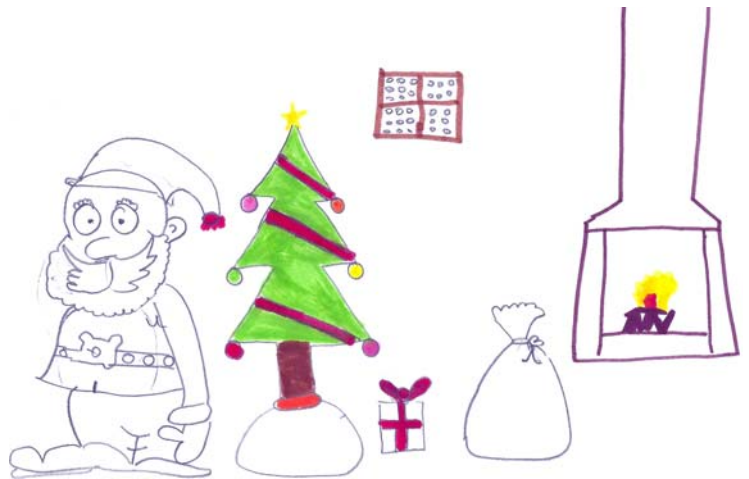
Ο Αη Βασίλης μοιράζει δώρα, Βίκυ 10,5 ετών