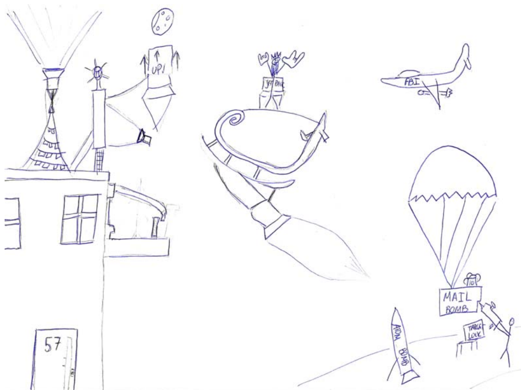
Γιάννης, 14 ετών